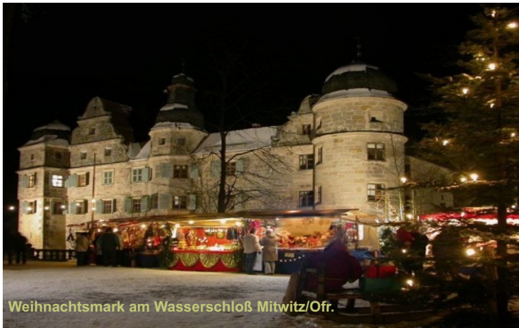
Weihnachtsmarkt am Wasserschloß Mitwitz/Ofr.

Wir wünschen eine geruhsame Adventszeit, frohe Weihnachten und Glück und Gesundheit im kommenden Jahr.